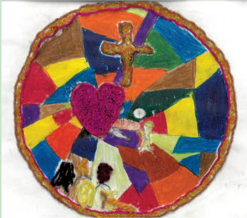
Seres Júlia alkotása