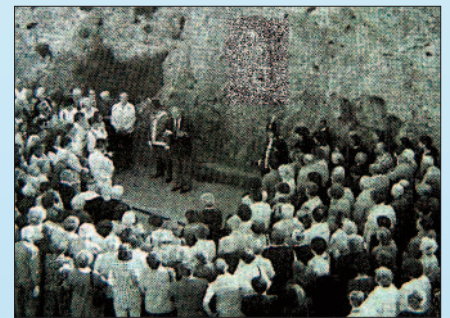
Kegyeleti hely átadása a viadukton

Szép és hálás színfoltja volt Veszprémnek ugyancsak ez év tavaszán, mikor a Padányi Biró Márton Katolikus Általános Iskolába járó diákok és szüleik szentmise keretében tettek bizonyosságot az iskola keresztény szellemiségéről a város katolikus templomaiban. Egy édesapa a II. Vatikáni Zsinat szavait idézte: „A katolikus iskola azon