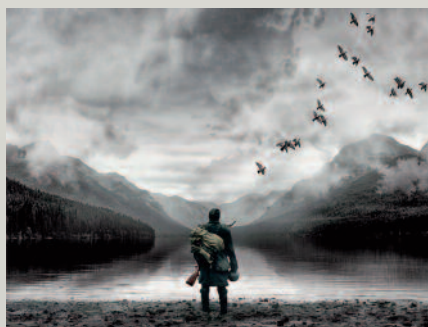
Jelenet a Szürke senkik című magyar háborús filmdrámából. Fotó: Mozinet, 2016

a neve is jelzi társadalmi státuszát: Alattvaló János) és családja civil életébe tekinthetett be a néző, s élhette át azt a drámát, amely akkoriban millió családot tönkretett: amikor a családfő megkapta a háborús katonai behívóparancsot. A hátrahagyottak hamarosan végzetes hírt kaptak