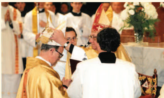
Püspökké szentelése Egerben

Jelmondata: „A szeretet soha el nem múlik” 1Kor 13,8