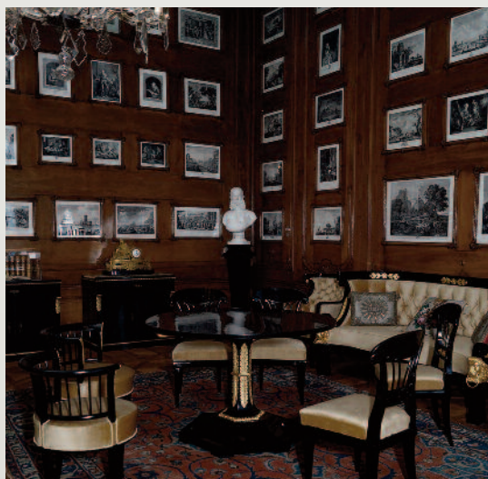
Az érseki palota megújított enteriőrkiállítása. Az I. Ferenc József fogadására készült felújított empire ülögarnitúra.

ICOM magyarországi szervezetének elnöke nyitotta meg. Azt gondolhatná a látogató, hogy egy egyházi épületben liturgikus tárgyak kiállítását látja majd, s bár itt is jelen vannak ezen műtárgyak, ám ez a kiállítás mégis elmozdul a profanitás felé, mutatott rá. Mintegy 100–150 éves történeti periódus enteriőrjeit látjuk a palota termeiben, amelyek máig élő helyi és nemzeti hagyományokba engednek bepillantást. Veszprémben a hagyományörzés különösen hangsúlyos, mutatott rá, hiszen a történelem része, hogy a veszprémi püspökök koronázták a magyar királynékat évszázadokon át. III. Béla amikor fölállította az első kancelláriát Magyarországon, kijelölte a királynéi kancellária vezetőjének a mindenkori veszprémi püspököt. Ettől kezdve a főpásztorok királynéi udvarhoz fűződő kapcsolata igen szoros, igen mély volt évszázadokon keresztül, s ez egészen Mohácsig tartott, majd a török kori fölszabadulás után újraéledt. Mindez ebben a nemesen, választékosan, kifinomultan berendezett és felújított, restaurált érseki palotában jelen van, erősen érződik a hely egyházi és hitbéli miliójában, bizonyítva: keresztény értékeink egyben tartanak bennünket. Sőt e keresztény értékek annyira jelentősek, hogy elérnek egészen Kínáig, elnyúlnak az arab világig, amint a palota kiállításán ez látható. Olyan hajszálgyökök ezek, amelyek az egész kontinent egyben tartják, és amelyek megalapozzák a mindennapi gondolkodásunkat – mutatott rá a Magyar Nemzeti Múzeum főigazgatója. De