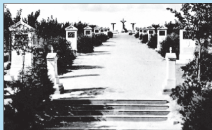
A IV. Károly Kálvária - egykori képeslapon