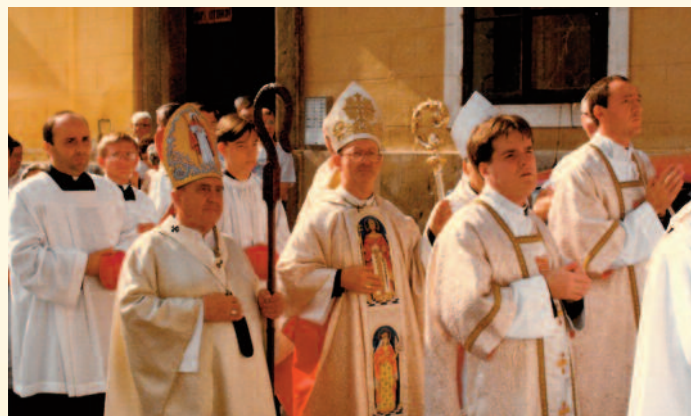
Veszprémi érseki beiktatás

Küldött: A Veszprémi Főegyházmegye lapja. Kiadja a Szaléziánium Érsekségi Turisztikai Központ, 8200 Veszprém, Vár u. 31. Tel.: 88/580-528, e-mail: kuldott@veszpremiersekseg.hu . A szerkesztőbizottság tagjai: dr. Márfi Gyula érsek, dr. Mail József, Megyesi Ferenc, Pálfalviné Ószi Judit. Munkatársak: Földi Gábor, Köviné Bösz Martina, Nagy Zoltán. Kéziratokat és fotókat nem őrzünk meg és nem küldünk vissza. A kéziratok rövidítési jogát fenntartjuk. Az újságban található cikkek a forrás megjelölésével szabadon felhasználhatók.