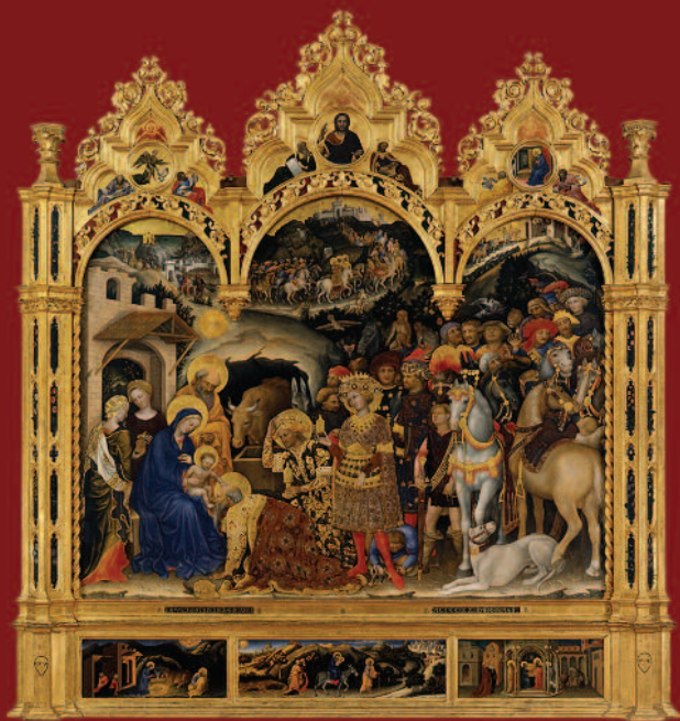
Gentile da Fabriano. Díltárkép, Háromkirályok imádása, 1423. Santa Trinita, Firenze

A Gyűjtemény kiadványai megrendelhetők és megvásárolhatók: 8200 Veszprém, Vár u. 35., +36 88 426 095, info.boldoggizella@gmail.com