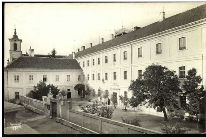
Veszprém Piarista gimnázium, XX. század első fele