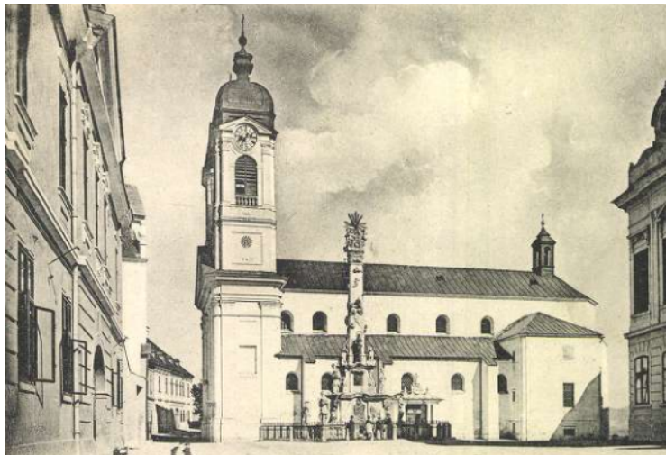
A Szent Mihály székesegyház épülete barokk kori küllemével a századfordulón