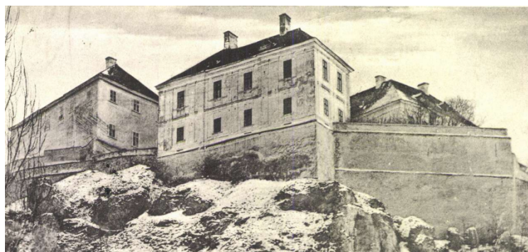
A Körmendy-palota észak felől egy 1901-ben kiadott képeslapon