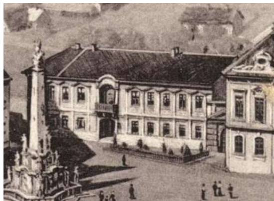
A Nagypréposti palota egy 1929-es rajzon