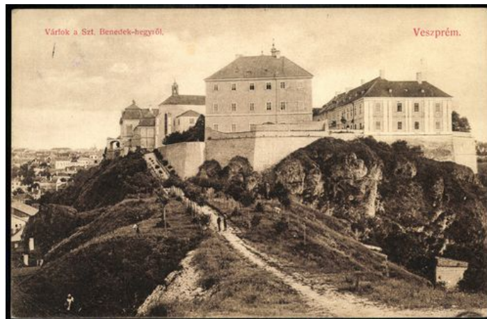
Veszprém Várlok a Szent Benedek-hegyről

A fejlesztési elképzelések pénzügyi elemzése szerint a projekt pénzügyi fenntarthatósága biztosított, az összes projektelképzelés megvalósítása és a tervezettek szerinti üzemeltetése esetén a nettó halmozott pénzügyi pénzáram egyik évben sem negatív. A létrejövő attrakciók hosszú távon fenntarthatók, legalább nullszaldós működéssel.